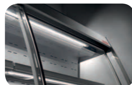
Illuminazione ripiani. Shelf lighting. Eclairage étagère. Beleuchtung für Etagen. Iluminación estantes. Подсветка полок.