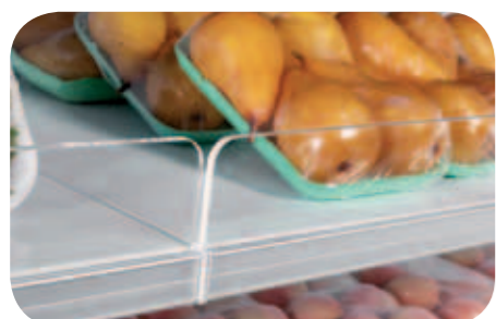
Spondine in plexiglas H80. Plexiglas front riser H80. Balconnet Plexiglas H80. Frontgitter aus Plexiglas H80. Barandilla plexiglass H80. Бортики из оргстекла H80.