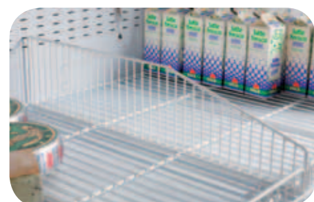
Divisori in filo per vasca. Base wire divider. Séparation cuve en fil. Trenngitter für Bodenauslage. Divisor cuba. Решетчатые перегородки для ванны.