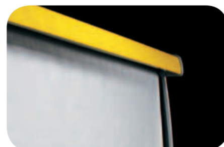
Tenda notte. Night blinds. Rideau de nuit. Nachttroll. Cortina nocturna. Ночная шторка.