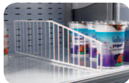
Divisori in filo per ripiani. Wire shelf divider. Séparation étagère en fil. Trenngitter für Etage. Divisor estante. Решетчатые перегородки для полок.