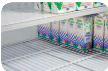
Griglie di fondo. Base grids. Grille de fond. Bodengitter. Rejilla cuba. Донные решетки.