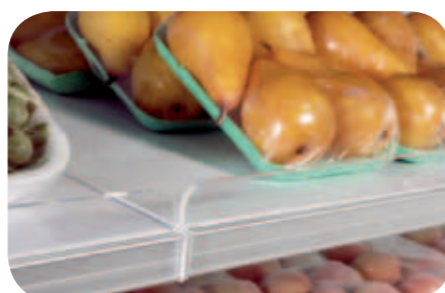
Spondine in plexiglas H45. Plexiglas front riser H45. Balconnet Plexiglas H45. Frontgitter aus Plexiglas H45. Barandilla plexiglass H45. Бортики из оргстекла H45.