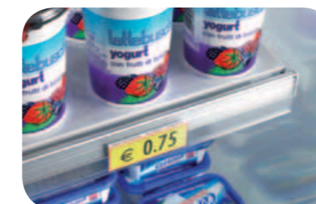
Portaprezzi trasparenti per ripiani. Transparent shelf ticket channel. Porte prix transparente étagère. Transparente Preisschienen für Etage. Portaprecios transparentes estantes. Прозрачные ценники для полок.